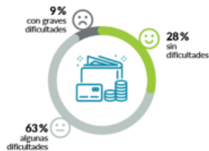
Situación económica de los hogares

Asociación de Vehículos Afectados por Restricciones Medioambientales